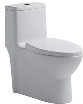
inodoro American Standard