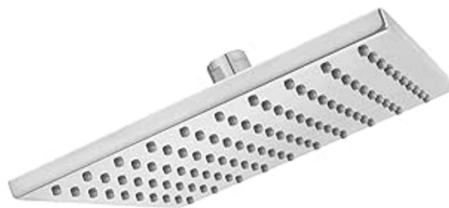
Regadera cromo American Standard